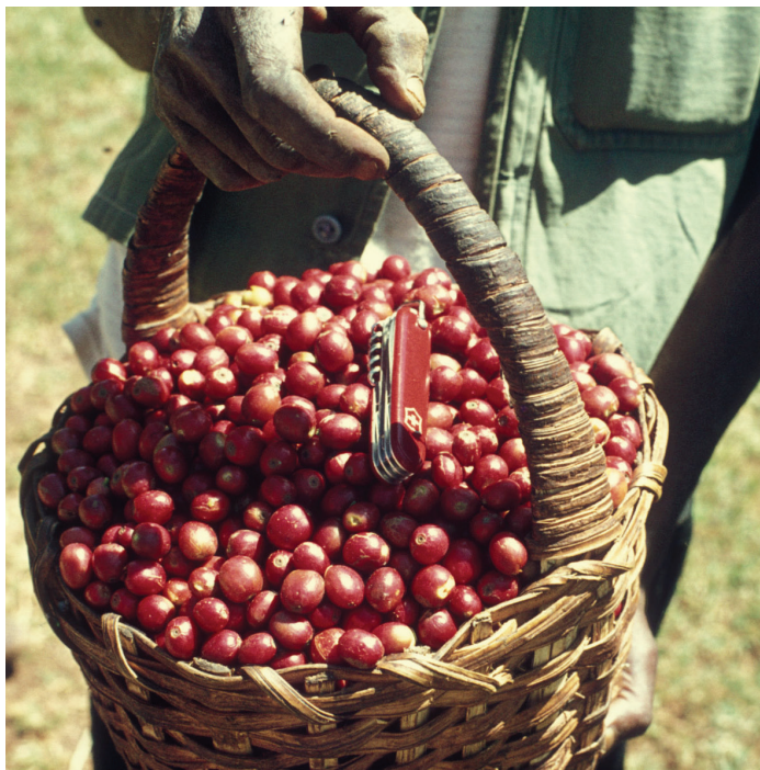
Un panier de cerises de café, Jimma Agaro, Ethiopie - Le café est la plus importante culture commerciale d'Ethiopie.

Le gouvernement a cherché à endiguer les pénuries de céréales ainsi que les prix intérieurs élevés en interdisant les exportations de céréales (comme le teff par exemple) et en les subventionnant les consommateurs. Cela a entraîné, cependant, une volatilité des prix et des pénalisations pour les agriculteurs.