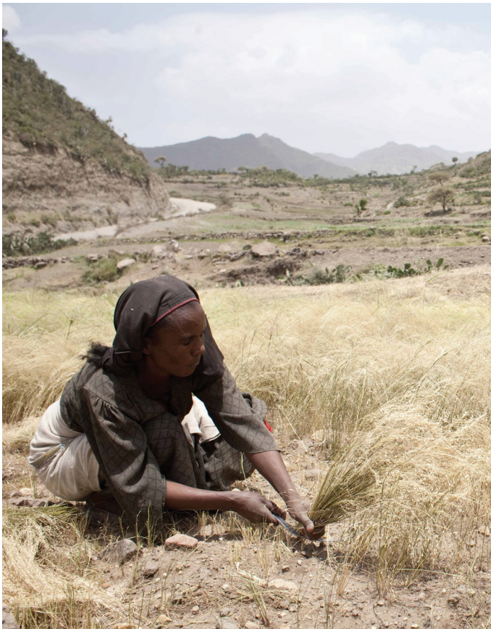
Tsehafti, Ethiopie - Une agricultrice récolte le teff, céréale la plus largement cultivée dans le pays.